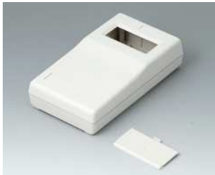
A9060007 UNI-MESS-BOX P, Ausf. I ABS (UL 94 HB) grauweiß RAL 9002 145x80x36,5mm