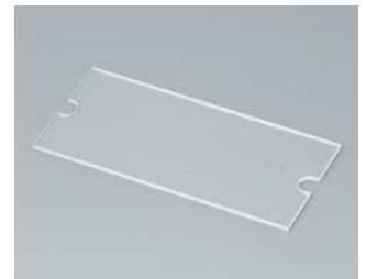
A9160005 Displayscheibe M Acrylglas transparent 60x30x1mm

Technische Änderungen vorbehalten. © OKW Gehäusesysteme, Buchen/Deutschland.