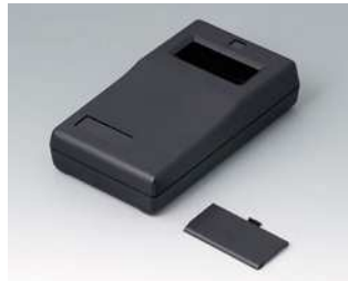
A9060009 UNI-MESS-BOX P, Ausf. I ABS (UL 94 HB) schwarz RAL 9005 145x80x36,5mm