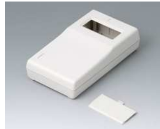
A9060017 UNI-MESS-BOX P, Ausf. II ABS (UL 94 HB) grauweiß RAL 9002 145x80x36,5mm