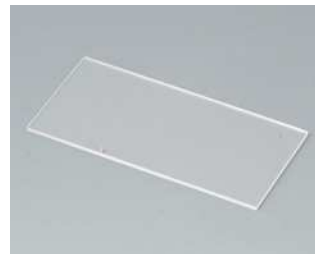
A9160004 Displayscheibe P Acrylglas transparent 60x30x1mm