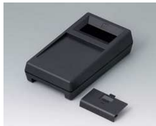
A9062019 UNI-MESS-BOX M, Ausf. I ABS (UL 94 HB) schwarz RAL 9005 145x80x38,5mm