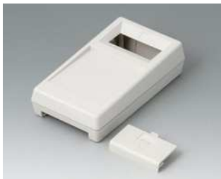
A9062017 UNI-MESS-BOX M, Ausf. I ABS (UL 94 HB) grauweiß RAL 9002 145x80x38,5mm