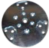
[ 1 ] Werkzeughalter komplett