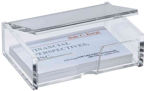
(a) Visitenkarten-Box, Acryl