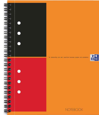
Collegeblock "NOTEBOOK", liniert