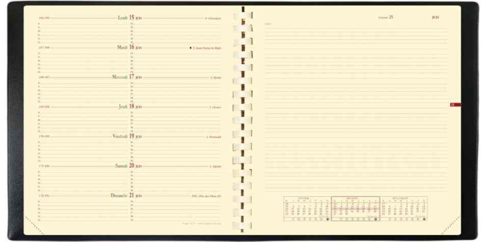
Agenda "NOTE 16 S", 160 x 160 mm - grille