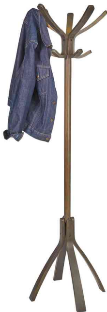
Portemanteau "CAFE", bois foncé