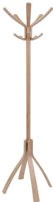
Portemanteau "CAFE", bois clair