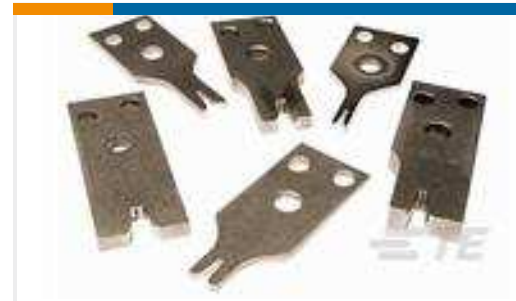
TE Teilnr.:1-654500-5 DRAHTCRIMPER