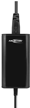
Universal-Steckernetzteil APS 2250L (ErP Level VI)