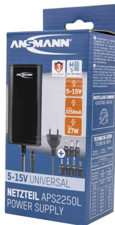
Universal-Steckernetzteil APS 2250L (ErP Level VI), in Verpackung