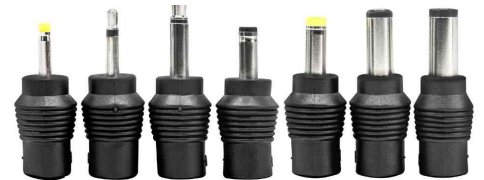
inkl. 7 verschiedenen Steckertypen