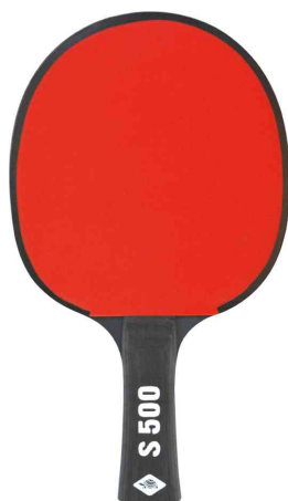
Raquette de tennis de table Protection Line "S500"