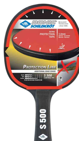
Raquette de tennis de table Protection Line "S500"