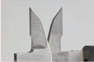
Keményfém külső és belső mérőpofával 505-735