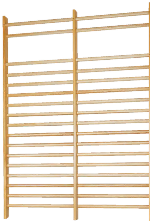
Abb. 1: Sport-Thieme Sprossenwand

Bewahren Sie die Anleitung gut auf. Für Fragen und Wünsche stehen wir Ihnen gerne zur Verfügung.