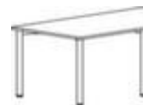
Table de conférence