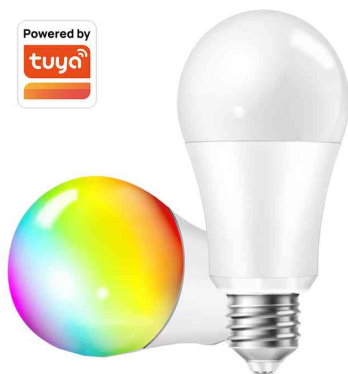
Ampoule LED WiFi Smart, culot : E27