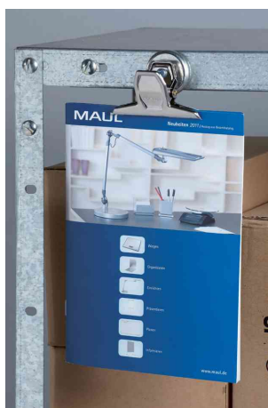
Visuel de référence: exemple d'utilisation