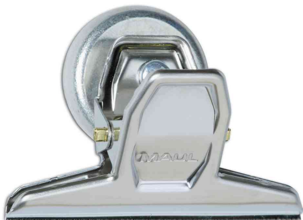
Pince-lettres MAULpro avec aimant