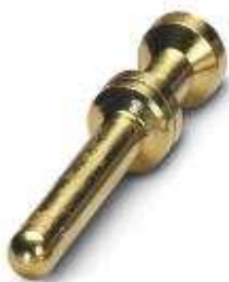
Gedrehter 2,5er Crimpkontakt, Stift-Einzelkontakt, Aderquerschnitt 2,5 mm 2 , vergoldet

Bitte beachten Sie, dass die hier angegebenen Daten dem Online-Katalog entnommen sind. Die vollständigen Informationen und Daten entnehmen Sie bitte der Anwenderdokumentation. Es gelten die Allgemeinen Nutzungsbedingungen für Internet-Downloads. ( http://phoenixcontact.de/download )