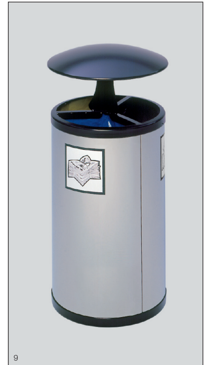
Abb.: Wertstoffstation mit Dach, in VA-Ausführung. Art.-Nr. 3667

Lieferung erfolgt einzeln, im Karton verpackt.