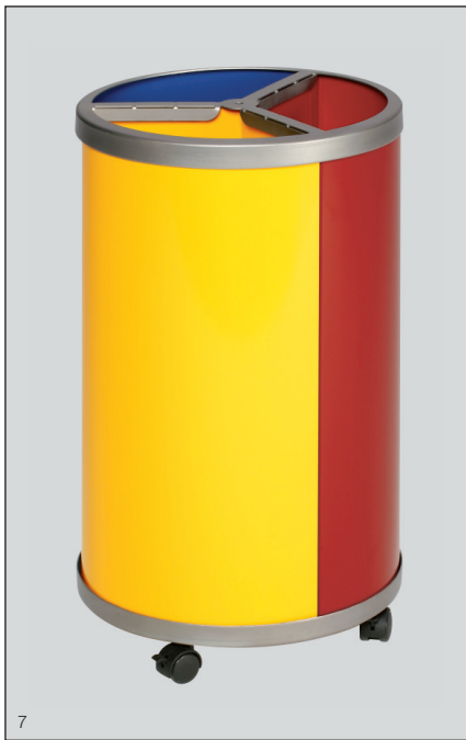
Abb.: Wertstoffstation mit Rollensatz. Art.-Nr. 3660 und Art.-Nr. 3669

Das Kopfteil dient gleichzeitig als Klemmvorrichtung für den Einsatz von 60-ltr. Kunststoffsäcken.