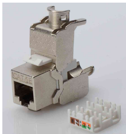
Keystone Modul Kat. 5e