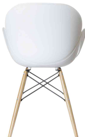
Chaise visiteur "KIWOOD", vue arrière