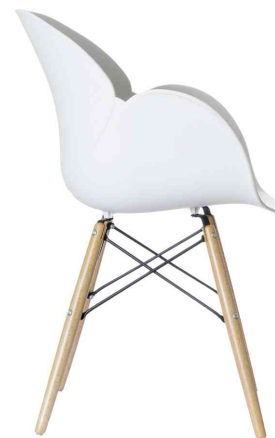
Chaise visiteur "KIWOOD", vue latérale