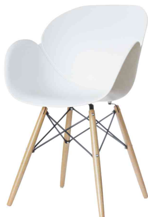
Chaise visiteur "KIWOOD", blanc

- fauteuil visiteur dans les coins détente ou les salles d'attente