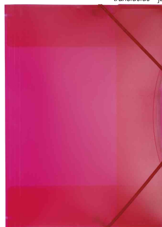
translucide - rouge