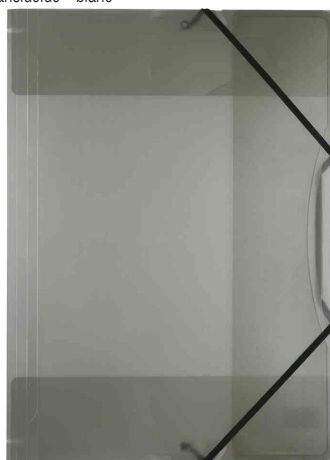
translucide - noir