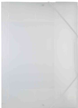
translucide - blanc