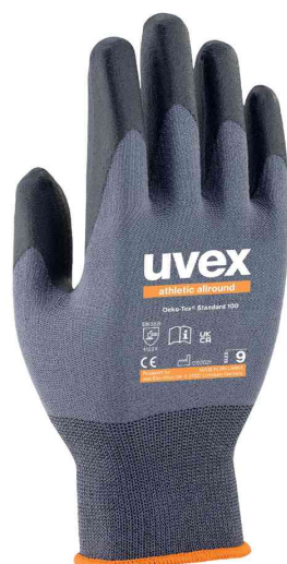
Gants de travail athletic allround