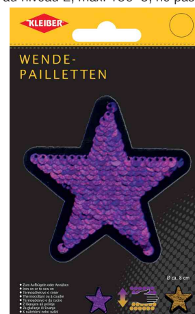
Etoile en sequins réversibles, violet-or