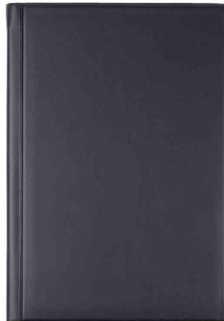
Buchkalender "Ultraplan", schwarz