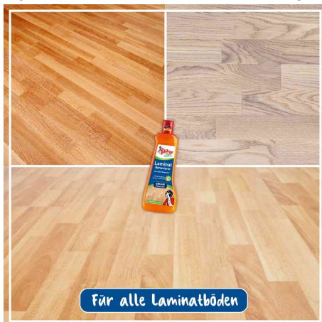
für alle Laminatböden