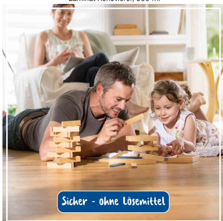
sicher - ohne Lösemittel