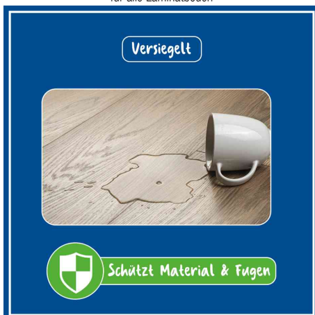
versiegelt - schützt Material & Fugen