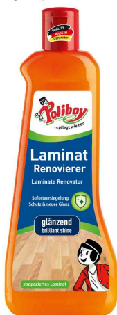
Laminat Renovierer, 500 ml