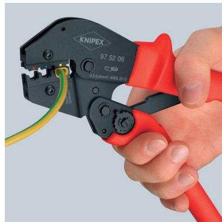
Segundo paso: ahora usar toda la mano para el resto del proceso de crimpado