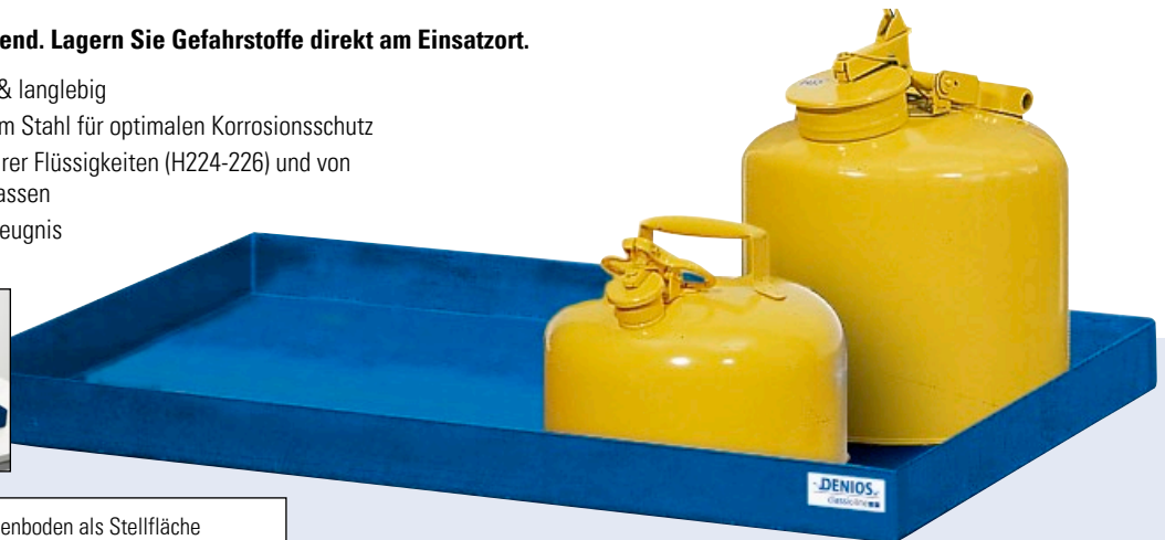
Feuerverzinktes Lochblech oder Wannenboden als Stellfläche