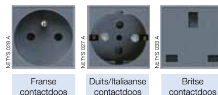
Fransen contactdoos Duits/Italiaanse contactdoos Britse contactdoos