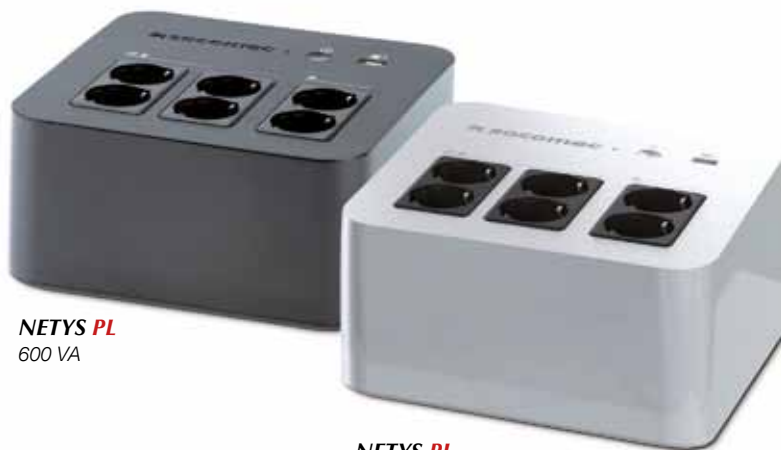
NETYS PL 600 VA