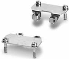
Adaptoreinsatz, Bauform: D25

Bitte beachten Sie, dass die in diesem PDF-Dokument angezeigten Daten aus unserem Online-Katalog generiert wurden. Bitte finden Sie die vollständigen Daten in der Benutzer-Dokumentation. Es gelten unsere Allgemeinen Nutzungsbedingungen für Downloads.