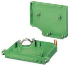
Kabelgehäuse, Rastermaß: 0 mm, Polzahl: 6, Maß a: 47,52 mm, Farbe: grün

Bitte beachten Sie, dass die in diesem PDF-Dokument angezeigten Daten aus unserem Online-Katalog generiert wurden. Bitte finden Sie die vollständigen Daten in der Benutzer-Dokumentation. Es gelten unsere Allgemeinen Nutzungsbedingungen für Downloads.