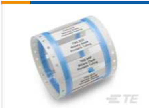
TE Teilenummer5061850001 MILITÄRTAUGLICHE TMS-SCE- HÜLSEN