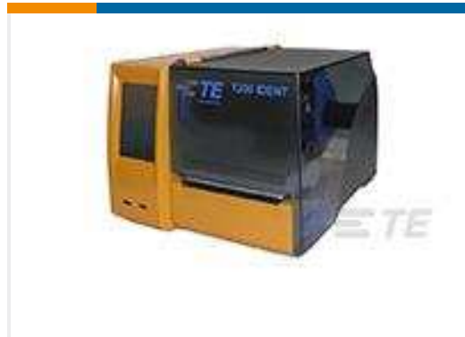
TE TeilenummerEC6996-000 T200-IDENT-PRINTER