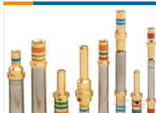
TE Teilenummer38941-22L CONTACTS