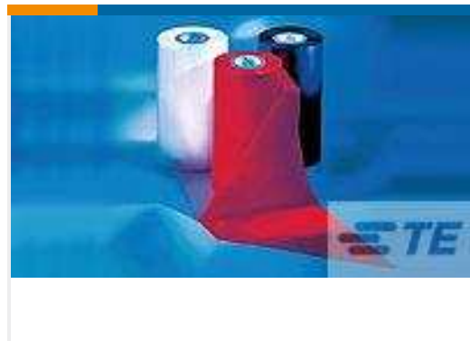
TE TeilenummerF55931-000 1966-RIBBON