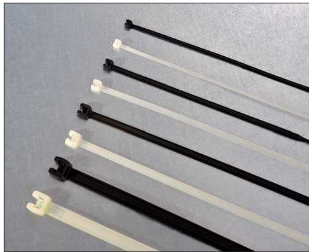
Q-tie Kabelbinder: eine große Auswahl an verschiedenen Abmessungen.

Nähere Beschreibungen der Werkzeuge finden Sie ab Seite 15.