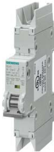
LEITUNGSSCHUTZSCHALTER 10KA, 1-POLIG, C, 30A NACH UL 489 - 277V