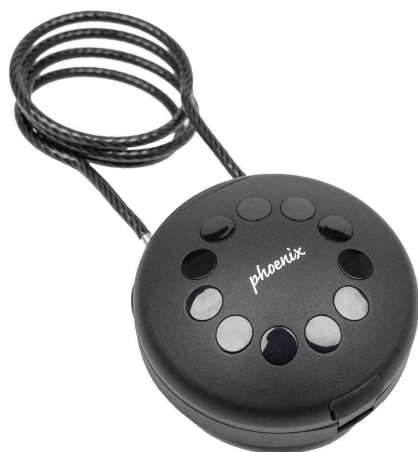
Boîte à clés PALM KS0212E, avec câble en acier