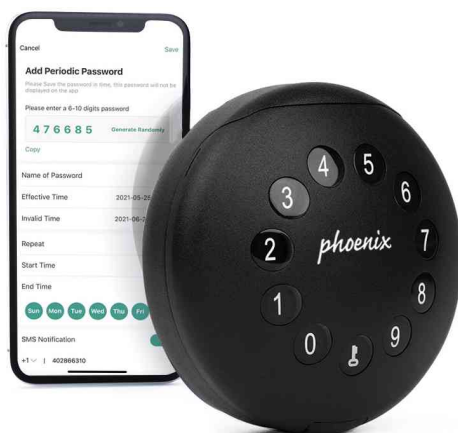
Boîte à clés PALM KS0212E, programmable avec app