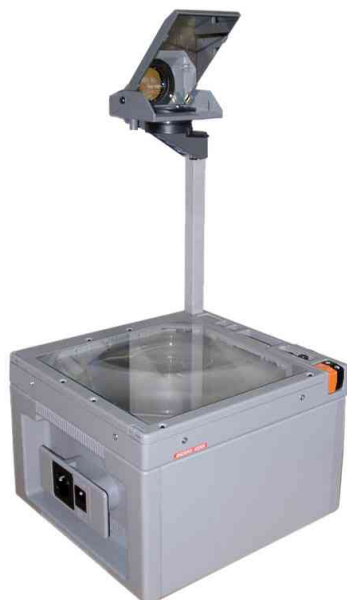
Overhead-Projektor EcoLux 40 Silent