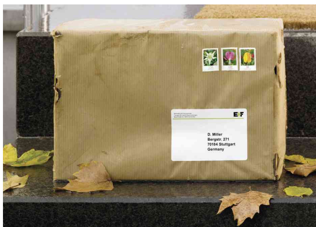
Etiquette d'expédition SPECIAL résistante aux intempéries, utilisation