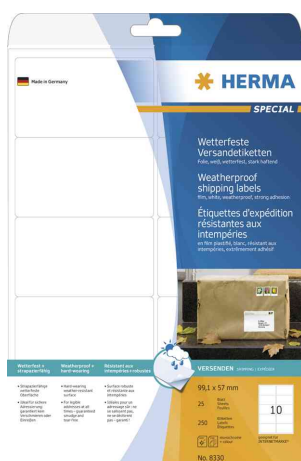
Visuel de référence: Etiquette d'expédition SPECIAL résistante aux intempéries

- adhère solidement aux enveloppes, aux colis, aux rouleaux d'expédition, aux feuilles, au PE et au Tyvek