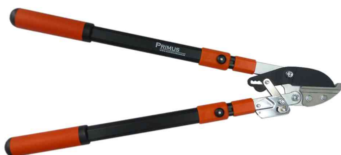
Coupe-branches à enclume - sécateur à crémaillère