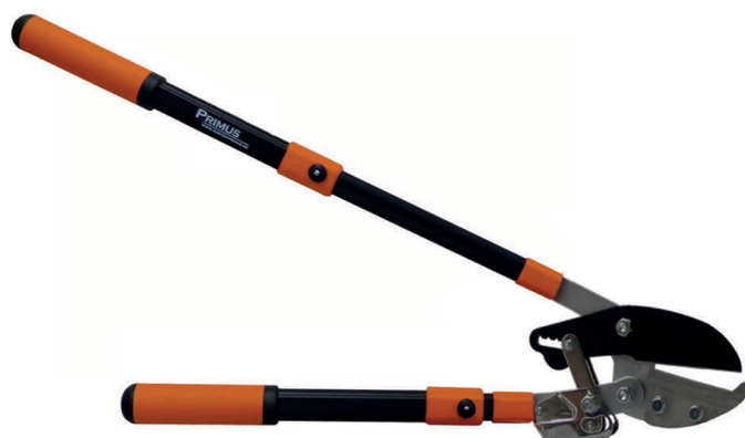
Coupe-branches à enclume - sécateur à crémaillère