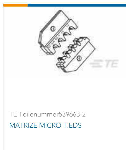
TE Teilenummer 539663-2 MATRIZE MICRO T.EDS