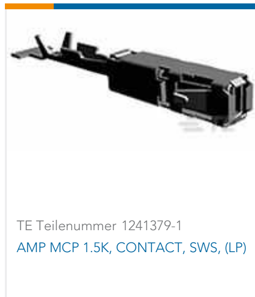
TE Teilenummer 1241379-1 AMP MCP 1.5K, CONTACT, SWS, (LP)