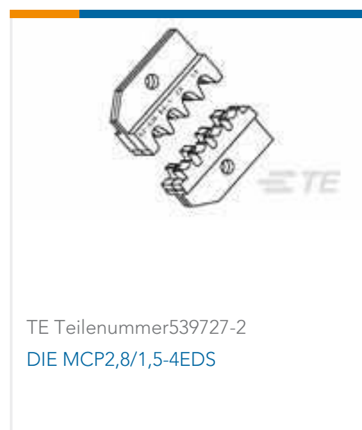
TE Teilenummer 539727-2 DIE MCP2,8/1,5-4EDS