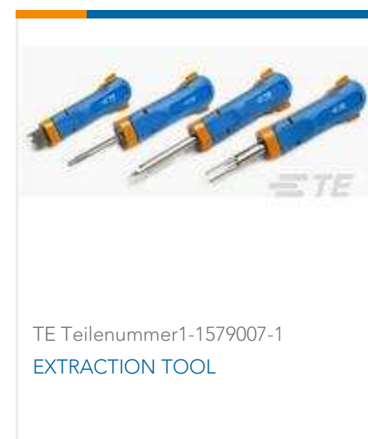
TE Teilenummer 1-1579007-1 EXTRACTION TOOL