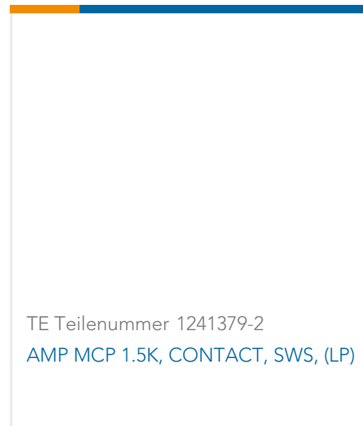
TE Teilenummer 1241379-2 AMP MCP 1.5K, CONTACT, SWS, (LP)