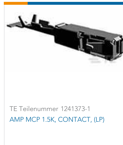
TE Teilenummer 1241373-1 AMP MCP 1.5K, CONTACT, (LP)