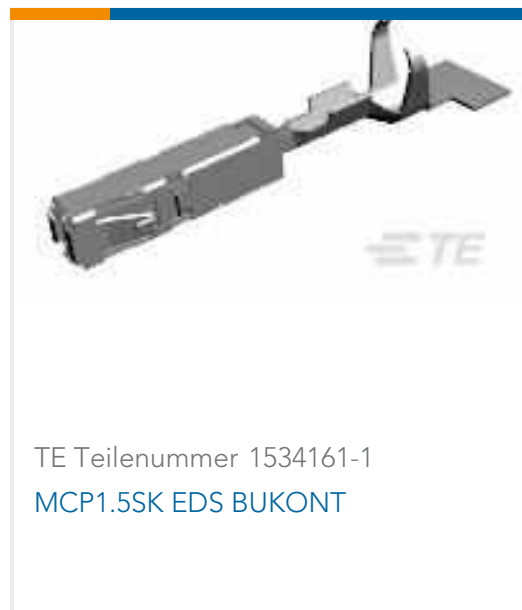
TE Teilenummer 1534161-1 MCP1.5SK EDS BUKONT