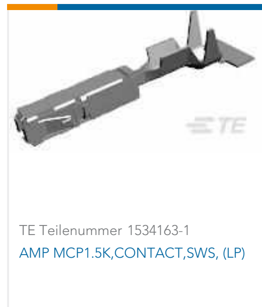
TE Teilenummer 1534163-1 AMP MCP1.5K,CONTACT,SWS, (LP)