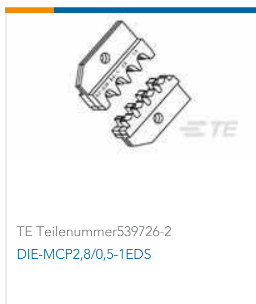
TE Teilenummer 539726-2 DIE-MCP2,8/0,5-1EDS