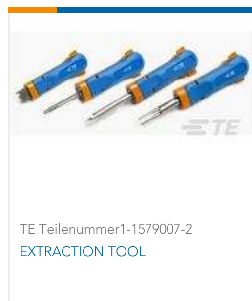
TE Teilenummer 1-1579007-2 EXTRACTION TOOL