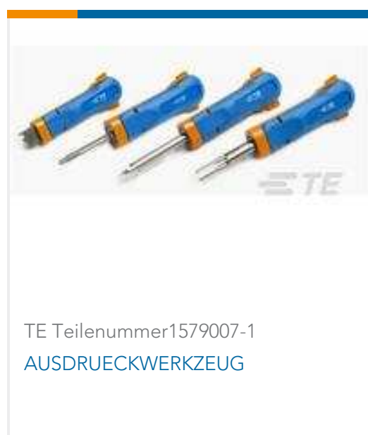
TE Teilenummer 1579007-1 AUSDRUECKWERKZEUG