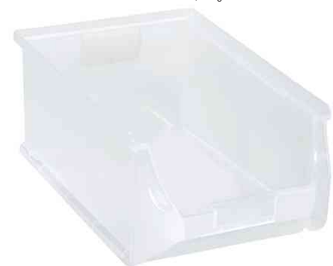
ProfiPlus Box 5, transparent