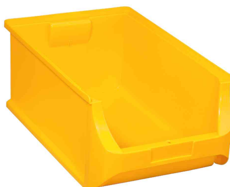
ProfiPlus Box 5, jaune