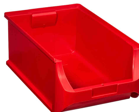
ProfiPlus Box 5, rouge