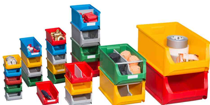
présente le choix des produits et des couleurs