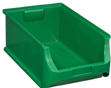
ProfiPlus Box 5, vert