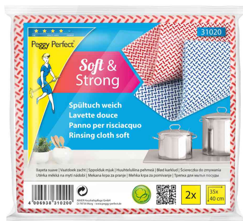
Lavette, paquet de 2