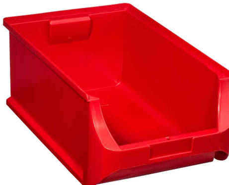
ProfiPlus Box 5, rot