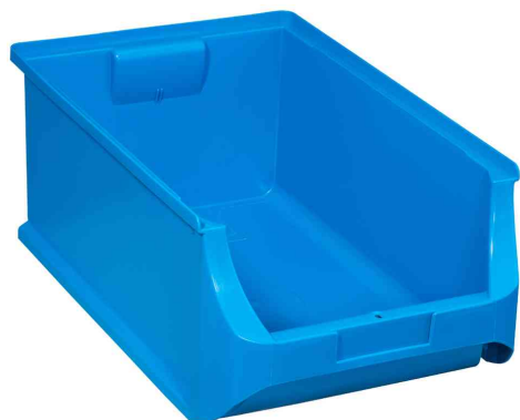
ProfiPlus Box 5, blau