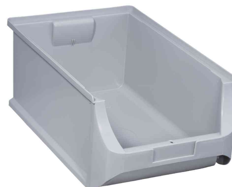
ProfiPlus Box 5, grau