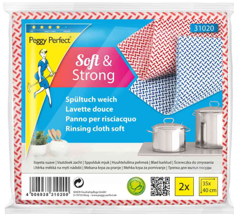
Spültuch, 2er Pack