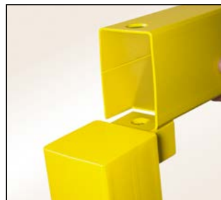
Einfache und schnelle Montage