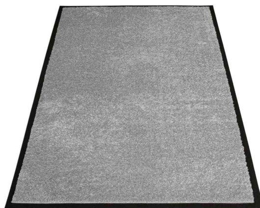
Tapis anti-salissure EAZYCARE SOFT, gris clair