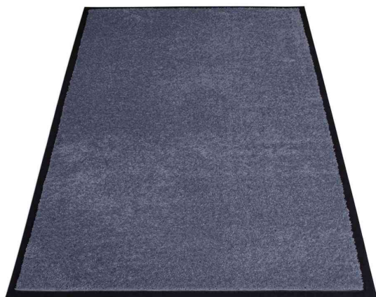
Tapis anti-salissure EAZYCARE SOFT, gris foncé