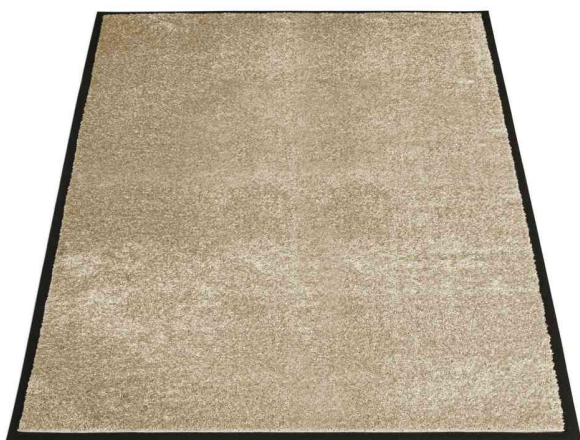
Tapis anti-salissure EAZYCARE SOFT, beige