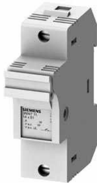
SENTRON, Zylindersicherungshalter, 14x51 mm, 1-polig, In: 50 A, Un AC: 690 V, LED Signalmelder