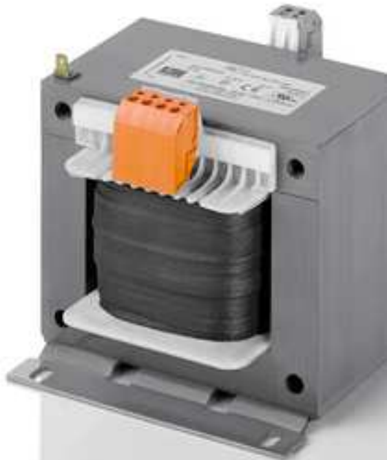
Abbildung zeigt STE 1000/4/23