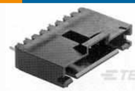
TE Teilenummer5-104362-2 03 MTE HDR SRST LATCH W/HLDWN