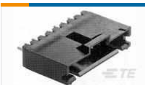
TE Teilenummer5-104362-4 05 MTE HDR SRST LATCH W/HLDWN