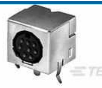
TE Teilenummer1658998-1 Mini DIN, 8 pos, R/A, Shield