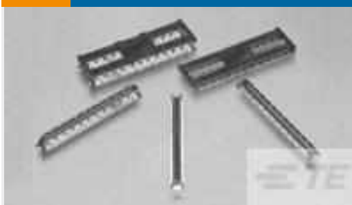
TE Teilenummer3-1827233-6 .5FHP05H,440,B,GIG,08/Sn,HT,NS