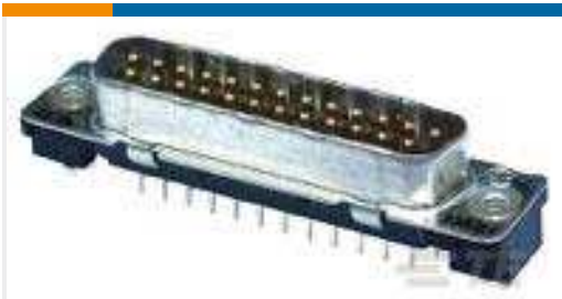
TE Teilenummer5748026-1 15 PLUG SP/FMS (IN,SL)