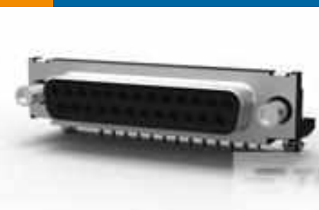
TE Teilenummer5747846-6 25 MSFL RCPT RA 318 (SL,FM,BL)