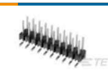
TE Teilenummer5-146130-4 10 MODII HDR DRST SFMNT B/A LF