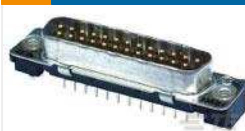
TE Teilenummer2-5748003-0 09 PLUG SP/FMS BRDLK