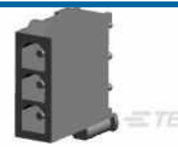
TE Teilenummer1-770170-1 03P MINI UMNL ASSY VO SNAU LF