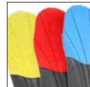
HAIX® Vario Wide Fit System