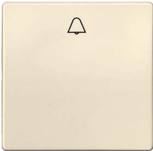
I-SYSTEM, ELEKTROWEISS WIPPE MIT SYMBOL GLOCKE FUER TASTER, 55X55MM