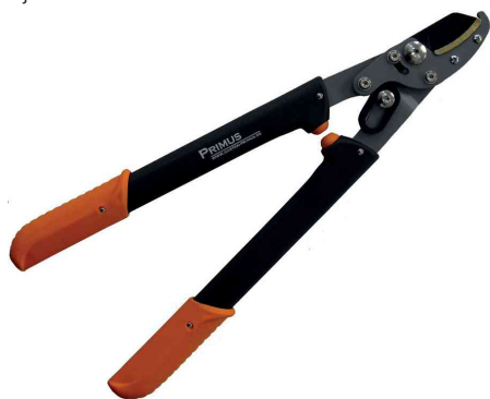
Coupe-branches pour dames