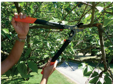
Visuel de référence : présente le produit en utilisation