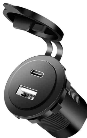
Adaptateur chargeur allume-cigare