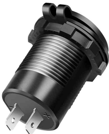
Adaptateur chargeur allume-cigare