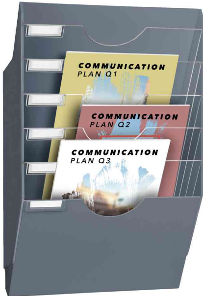
Wandprospekthalter ReCeption, grau

- für die übersichtliche Präsentation von Katalogen, Zeitschriften etc.